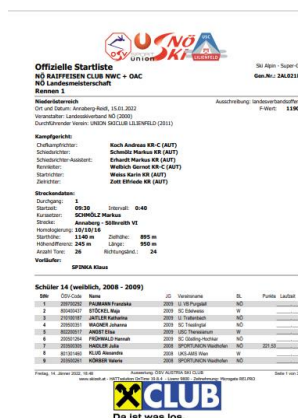
Muster PDF-Liste Logoanordnung